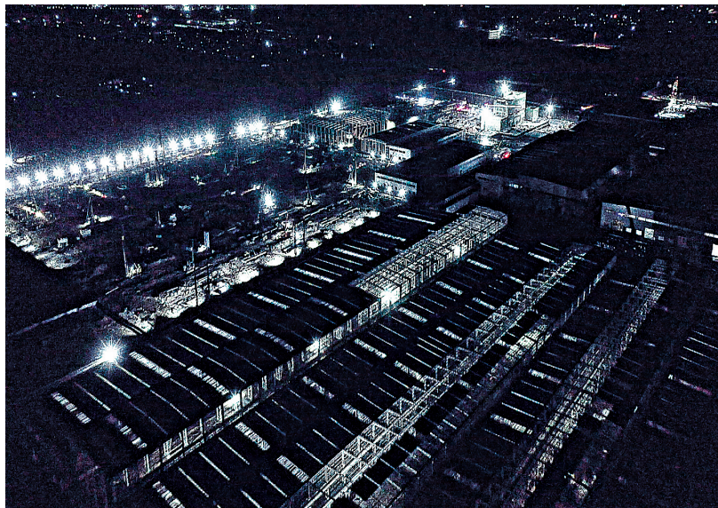
深夜,灯火通明的智能高端装备产业园区施工现场航拍图

全面提速建设智能高端装备产业园区,是公司深化改革、提质增效,推进高质量高速发展的重要载体和强大引擎。集团公司党委书记、董事长韩珍堂在调研时强调,“要强化举措、狠抓落实,统筹做好进度、质量、安全各项工作。”为全方位贯彻落实公司安排部署,扎实做好园区建设工作,把失去的工期抢回来,新园区建设现场昼夜施工,挖掘机铁臂挥舞,土方车辆来回穿梭,大型机械运转不停,到处一派繁忙景象。(下转第二版)